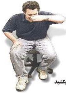
بنشینید و کمی به سمت جلو خم شوید

خونسردی خود را حفظ کرده، روی صندلی بنشینید و سر خود را کمی به جلو خم کنید. به مدت ۱۰ دقیقه فشار مستقیم بر بالاترین قسمت نرم بینی، دقیقاً پائین پل استخوان بینی وارد کنید. در صورتیکه خونریزی کنترل نشد به مدت ۱۵ دقیقه از کمپرس سرد استفاده کنید. اگر با انجام مراحل بالا در زمان کمتر از ۳۰ دقیقه خونریزی متوقف نشد، به مرکز پزشکی مراجعه کنید.