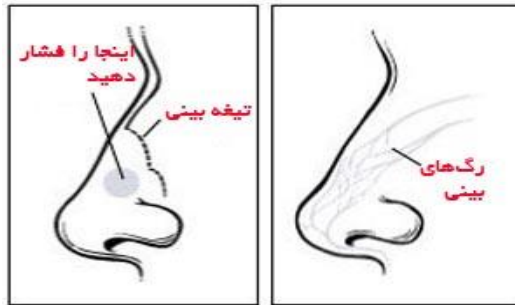
سوراخ های بینی را محکم بگیرید